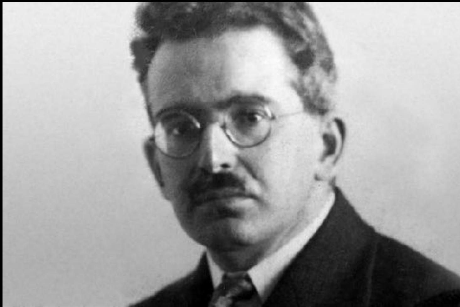
Walter Benjamin (1892 - 1940)

"Bekanntlich war es den Juden untersagt, der Zukunft nachzuforschen. Die Thora und das Gebet unterweisen sie dagegen im Eingedenken. Dieses entzauberte ihnen die Zukunft, der die verfallen sind, die sich bei den Wahrsagern Auskunft holen. Den Juden wurde die Zukunft aber darum doch nicht zur homogenen und leeren Zeit. Denn in ihr war jede Sekunde die kleine Pforte, durch die der Messias treten konnte. "